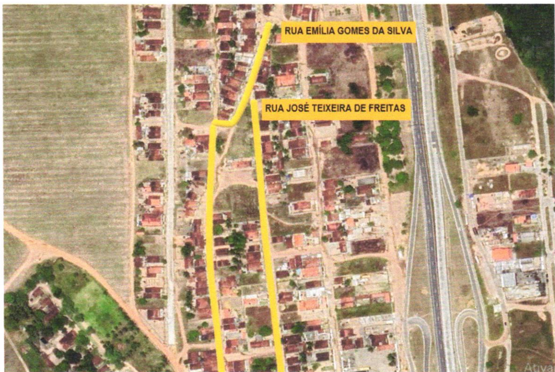
Rua José Teixeira de Freitas – Bairro Cidade Nova